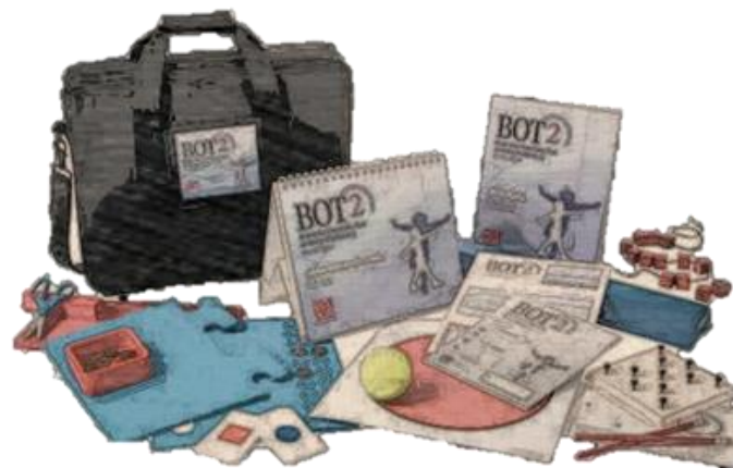
Figura 2 - Teste Bruininks-Oseretsky de Proficiência Motora 2ed. (BOT2)