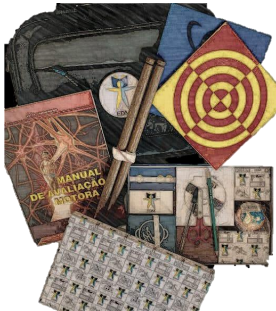
Figura 4 - Escala de Desenvolvimento Motor (EDM).

O EDM criado por Francisco Rosa Neto, é a única bateria nacional com validação e que contempla diferentes habilidades do desenvolvimento motor. Bastante utilizada em clínicas como processo de investigação de atrasos motores, ao permitir identificar: Idades motoras; quocientes motores; escala motora; e perfil motor.