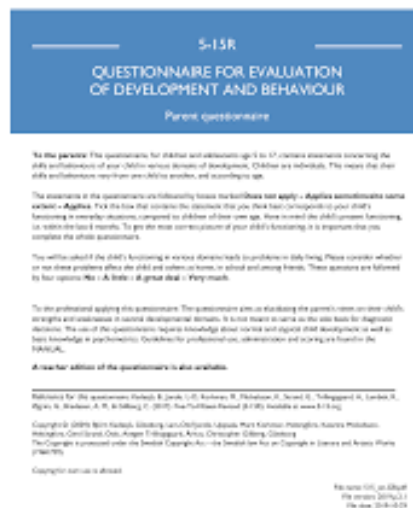
Figura 6 - Five to Fifteen (5-15R). Fonte: capa do questionário versão revisada 5-15R