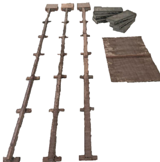
Figura 3- Teste de Coordenação Corporal para Crianças (KTK).